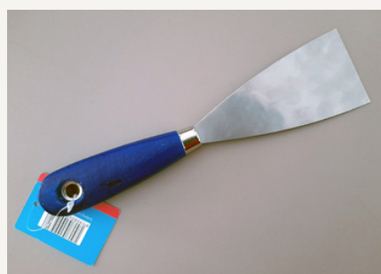
Lopatica za kitanje