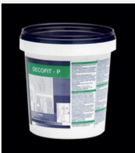
lepilo za stiroporne letve

Tako pripravljene letve dodatno pobarvajte z akrilnimi stenski barvami. Z malo poguma lahko dobite odličen rezultat. To je prepuščeno vaši domišljiji!